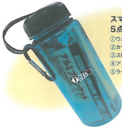
スマートエマージェンシーボトル 5点セット