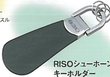
RISOシューホーン キーホルダー