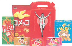
「セレクション・ザ・グリコ」

ご来場の記念に左記の中からご希望の品をおひとつプレゼントいたします。下記の「ご来場予約申込書」に必要事項をご記入のうえ、FAXにてご返信ください。